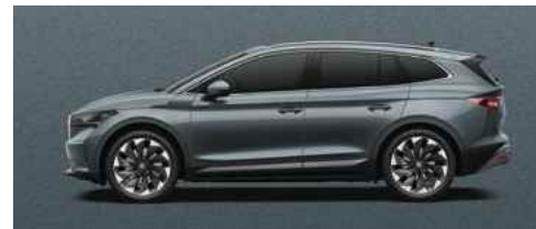
GRAPHITE GREY METĀLISKA KRĀSA 710 €