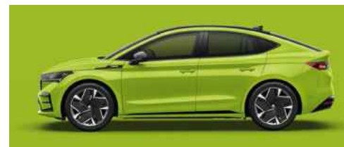
MAMBA GREEN STANDARTA KRĀSA 470 € (tikai RS)