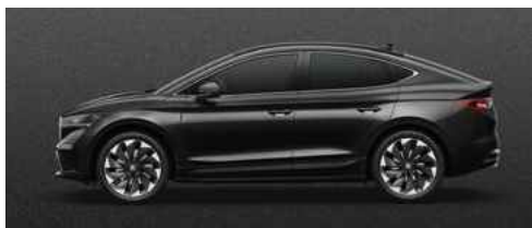
BLACK MAGIC PEARLESCENT METĀLISKA KRĀSA 710 €