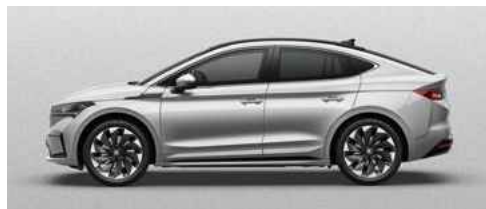
BRILLIANT SILVER METĀLISKA KRĀSA 710 €