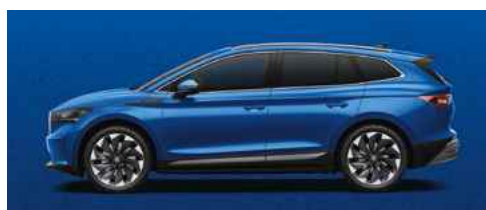
RACE BLUE METĀLISKA KRĀSA 710 €