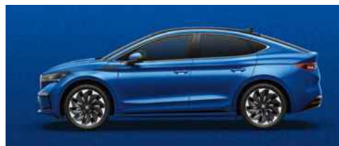
RACE BLUE METĀLISKA KRĀSA 710 €