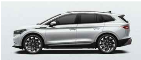
MOON WHITE METĀLISKA KRĀSA 710 €