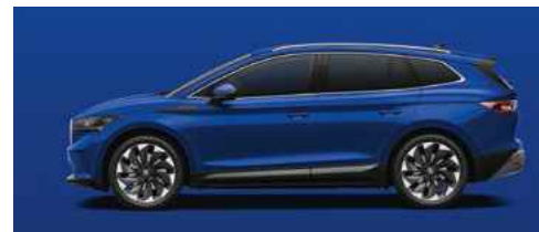
ENERGY-BLUE STANDARTA KRĀSA 0 €