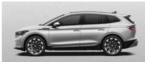
BRILLIANT SILVER METĀLISKA KRĀSA 710 €