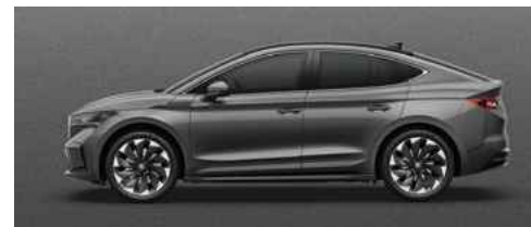
GRAPHITE GREY METĀLISKA KRĀSA 710 €