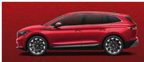
VELVET RED SPECIĀLĀ KRĀSA 1 180 €