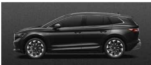
BLACK MAGIC PEARLESCENT METĀLISKA KRĀSA 710 €