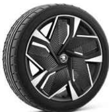
21" VISION AERO disku uzlikas 770 €