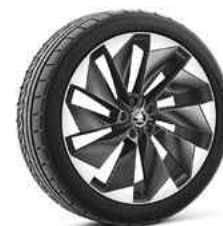
21" SUPERNOVA antracīta metālika 1 580 €