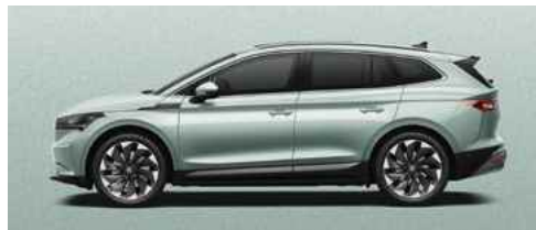
ARCTIC SILVER METĀLISKA KRĀSA 710 €