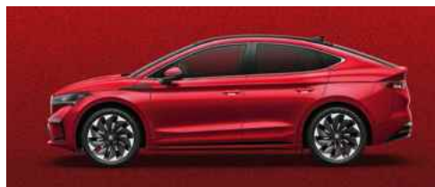
VELVET RED SPECIĀLĀ KRĀSA 1 180 €