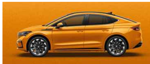
PHOENIX ORANGE METĀLISKA KRĀSA 1 180 €