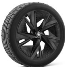
20" TAURUS BLACK AERO disku uzlikas