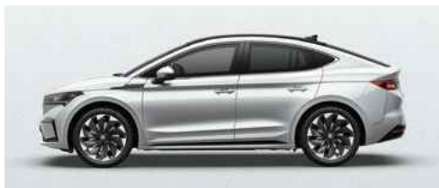
MOON WHITE METĀLISKA KRĀSA 710 €