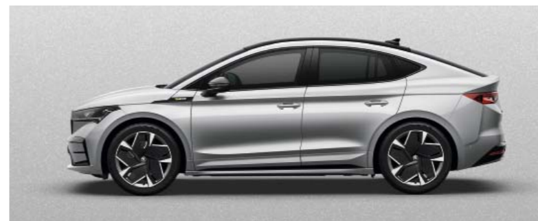
BRILLIANT SILVER METĀLIKA