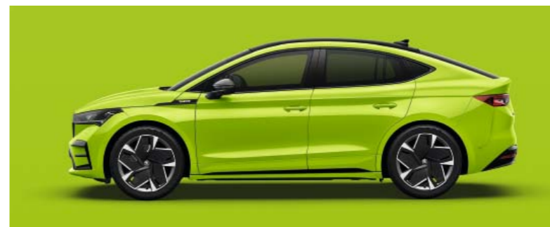
MAMBA GREEN UNI