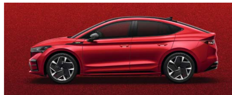
VELVET RED METĀLIKA