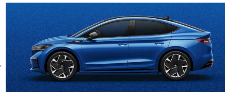
RACE BLUE METĀLIKA