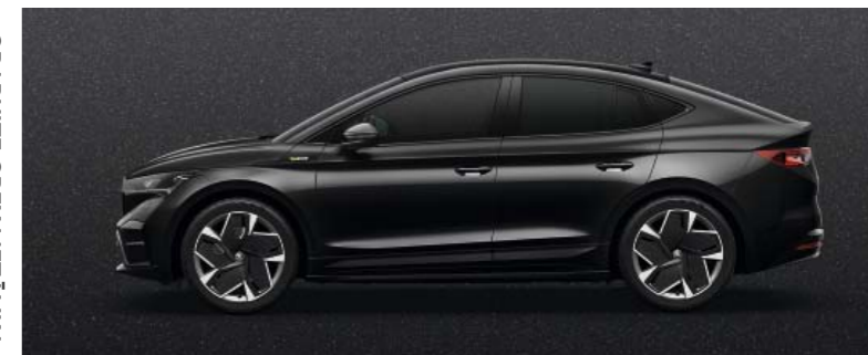
MAGIC BLACK METĀLIKA

Krāsū gammā ietilpst arī Energy Blue UNI (nav parādīta).