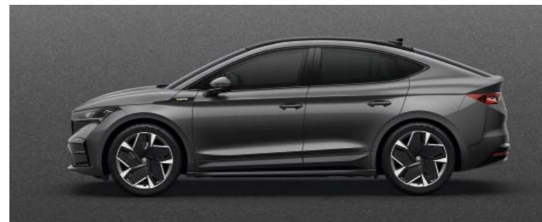
GRAPHITE GREY METĀLIKA