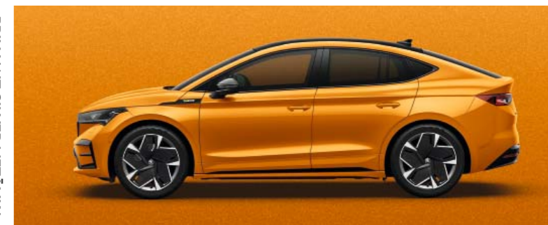
PHOENIX ORANGE METĀLIKA