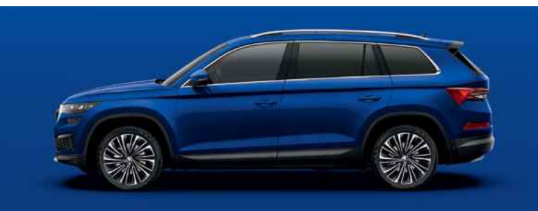
Standarta krāsa ENERGY BLUE