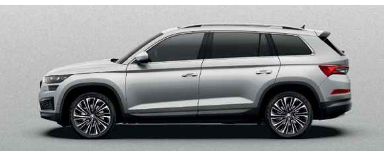
Metāliskā krāsa BRILLIANT SILVER