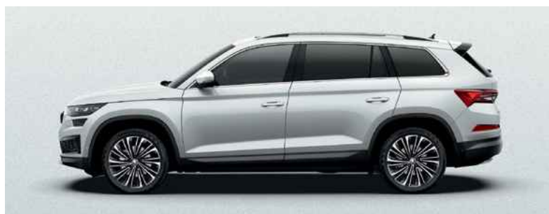
Metāliskā krāsa MOON WHITE