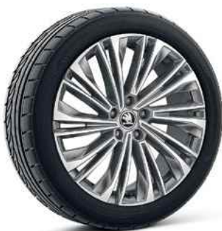
19" vieglmetāla diski CURSA ANTHRACIT