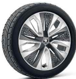
19" vieglmetāla diski PROCYON ANTHRACIT