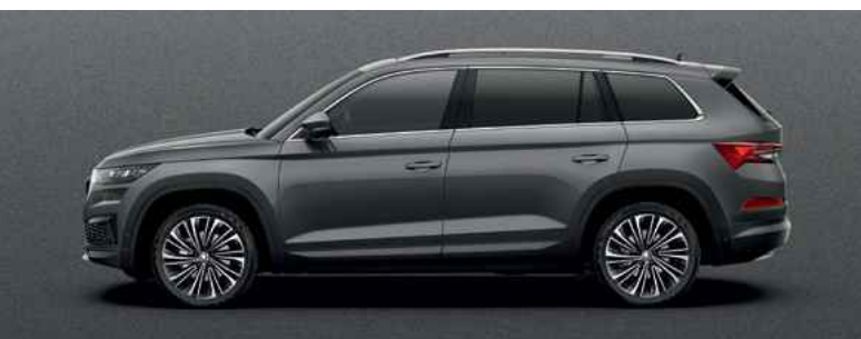
Metāliskā krāsa GRAPHITE GREY