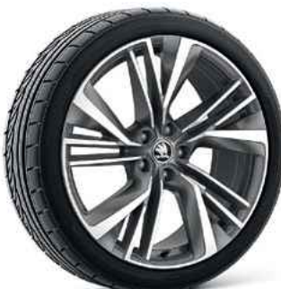
20" vieglmetāla disk IGNITE ANTHRACITE