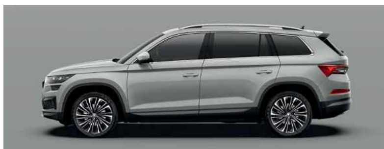
Nemetāliskā krāsa STEEL GREY