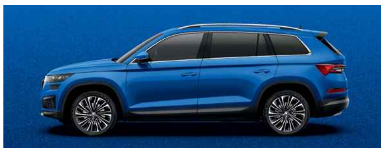
Metāliskā krāsa RACE BLUE