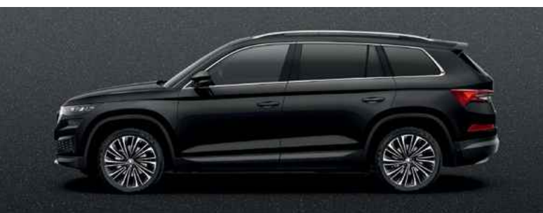
Metāliskā krāsa MAGIC BLACK