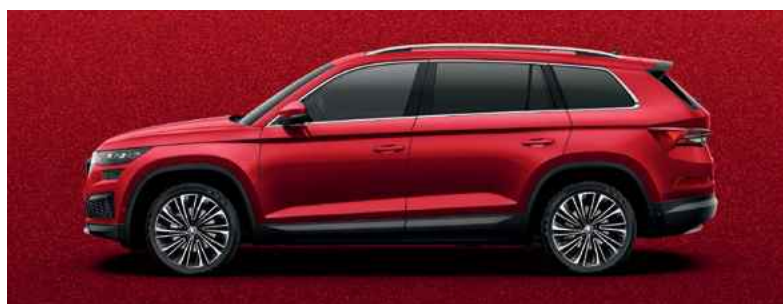
Speciālais krāsojums VELVET RED