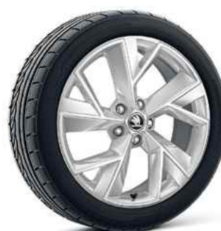
19" vieglmetāla diski TRIGLAV