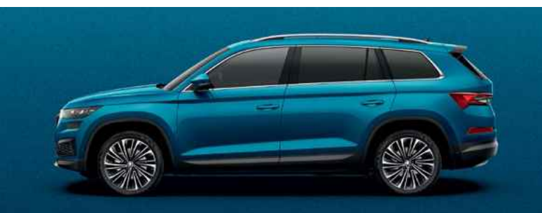
Metāliskā krāsa LAVA BLUE