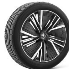
20" NEPTUNE AERO disku uzlikas 920 €