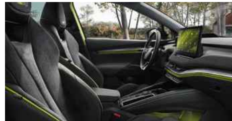
DIZAINA PAKETE "RS LOUNGE"