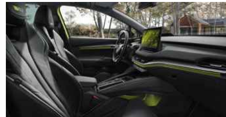
DIZAINA PAKETE "RS SUITE"