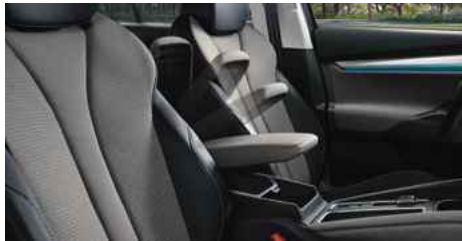
DIZAINA PAKETE "LOFT"