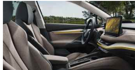
DIZAINA PAKETE "LODGE"