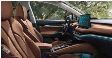
DIZAINA PAKETE "ECO SUITE"