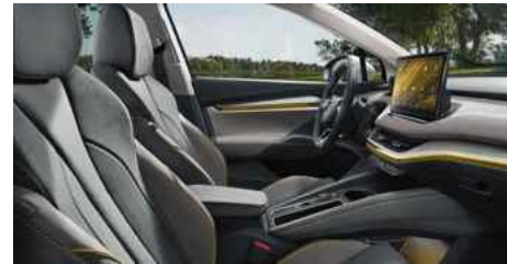
DIZAINA PAKETE "LOUNGE"