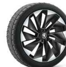
21" SUPERNOVA melna metālika 1 580 €