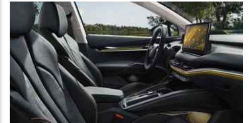
DIZAINA PAKETE "SUITE BLACK"